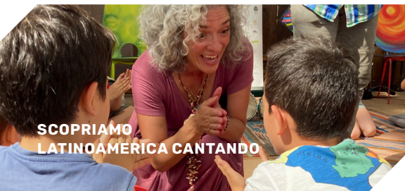
SCOPRIAMO LATINOAMERICA CANTANDO