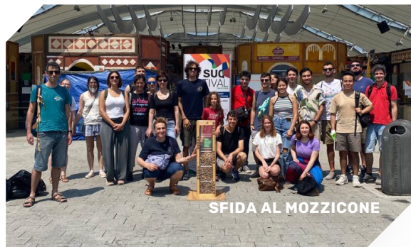
SFIDA AL MOZZICONE