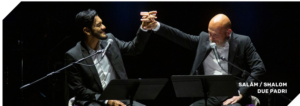
SALĀM / SHALOM DUE PADRI

Abbracciarsi, tenersi la mano. Guardarsi negli occhi. Ascoltarsi, soprattutto. Piccoli gesti normali, per tempi normali. Per tempi di pace. Gesti eroici quando il tempo della guerra devasta e travolge le vite degli uomini. Infinito è il numero di lati dell'apeirogon, infinite e mutevoli le cose del mondo, luogo del caos.